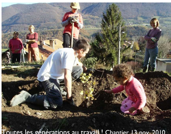
Toutes les générations au travail ! Chantier 13 nov. 2010.

Enfin, nos recherches de financements se sont orientées vers le Conseil Général de l'Isère qui instruit notre dossier en cette fin d'année. Le Tichodrome a également déposé sa candidature auprès de plusieurs Fondations. Nous vous tiendrons bien sûr informés des financements obtenus.