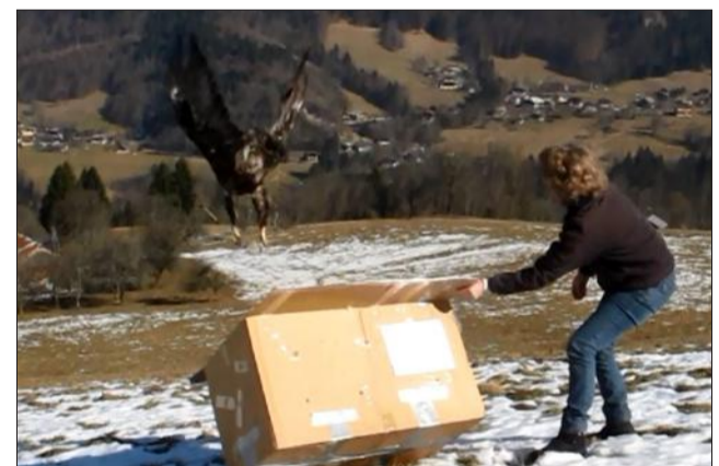
En pleine forme, l'aigle royal a pris son envol en quelques secondes. Mensurations du bébé : 4,5kg pour 2,20mètres d'envergure.

secteurs gestion des risques et banque, assurances, immobilier avaient dressé des stands. Alors que le Forum 2016