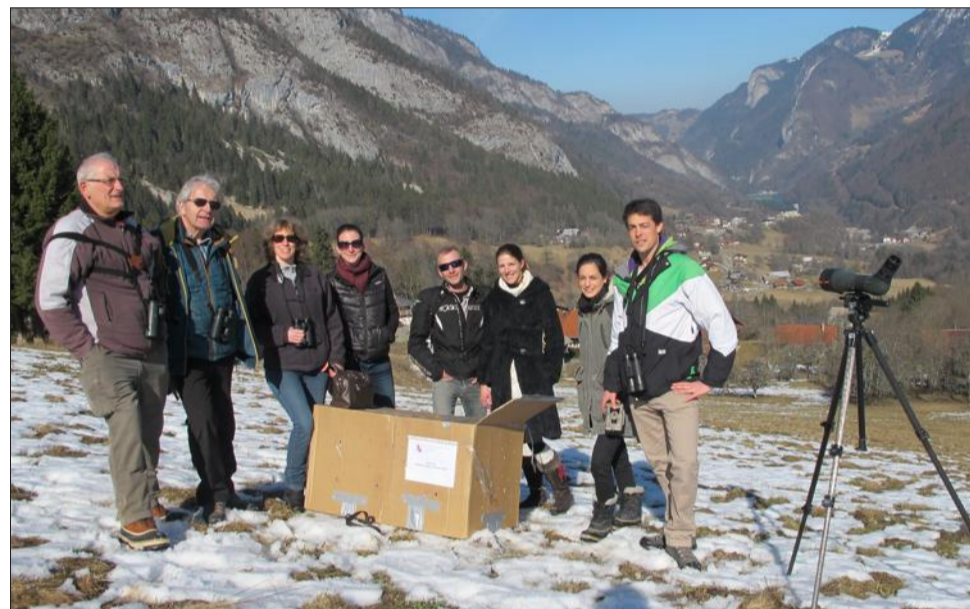
L'aigle royal a bénéficié d'une incroyable chaîne de soins depuis son recueil fin décembre par un couple de Seytroux. COR, Tichodrome, LPO... tous les acteurs du sauvetage étaient présents hier pour sa remise en liberté.

Requiqué sur les rives genevoises, l'aigle royal a rejoint la banlieue grenobloise début février. Objectif : lui permettre de se remuscler dans les grandes volières du Tichodrome, un centre de